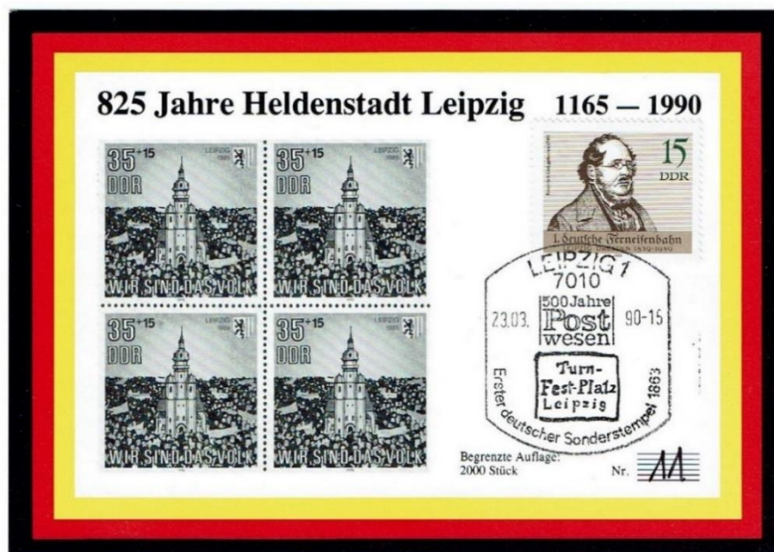
Abbildung 3: Angebliche Maximumkarte „825 Jahre Heldenstadt Leipzig“,

In der großen Gruppe der privaten Maximumkarten gibt es teils erhebliche Qualitätsunterschiede. Gelegentlich werden auch Maximumkarten angeboten, die keine sind. Das Beispiel eines unbekanntenen Herausgebers zeigt die Abbildung 3. Bei dieser Karte fehlen thematische und zeitliche Übereinstimmungen zwischen Briefmarke, Kartenmotiv und Sonderstempel.