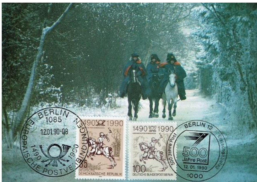
Abb. 1: Maximumkarte (1a) „500 Jahre Postverbindungen in Europa“