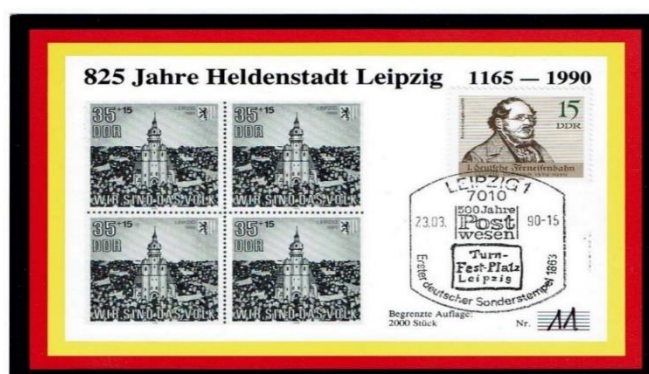
Abbildung 3: Angebliche Maximumkarte „825 Jahre Heldenstadt Leipzig“

In der großen Gruppe der privaten Maximumkarten gibt es teils erhebliche Qualitätsunterschiede. Gelegentlich werden auch Maximumkarten angeboten, die keine sind. Das Beispiel eines unbekanntenen Herausgebers zeigt die Abbildung 3. Bei dieser angeblichen „Maximumkarte“ fehlen die thematischen und zeitlichen Übereinstimmungen zwischen Briefmarke, Kartenmotiv und Sonderstempel.