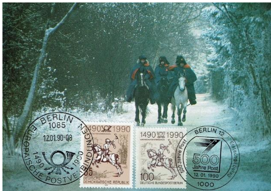
Abb. 1: Maximumkarte (1a) „500 Jahre Postverbindungen in Europa“